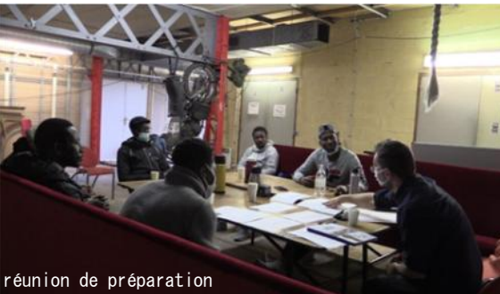
réunion de préparation

Ce dispositif m'amena à travailler à la fois avec des comédiens professionnels et non professionnels rencontrés sur le terrain.