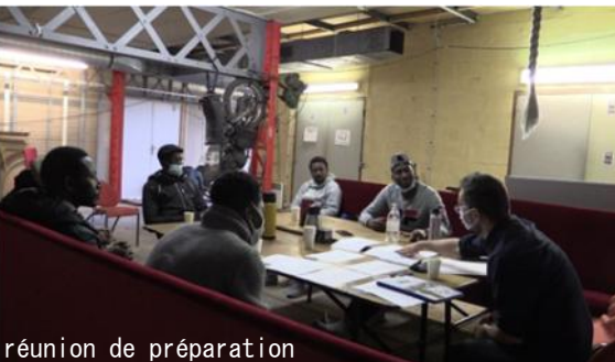
réunion de préparation

Ce dispositif m'amena à travailler à la fois avec des comédiens professionnels et non professionnels rencontrés sur le terrain.